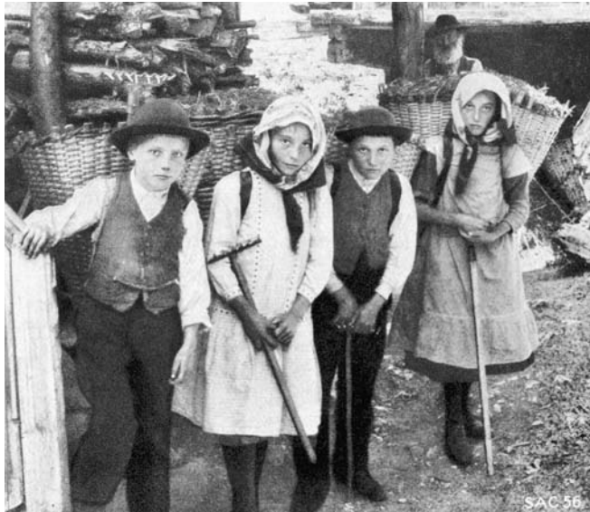
Abbildung 4: Knaben und Mädchen mit gefüllten Chris-Tschifferen (Eggwald, Zeneggen, STEBLER 1922, S. 103).

frorenen Erde in Tüchern auf Ästen zu den Schlitten und mit diesen zu den Ställen gezogen. Andernorts wurde die Waldstreue unter Dach zwischengelagert, so in Uri in so genannten «Streiwi-Stadeln», einem balkonähnlichen Ausbau unter dem Gadendach, im Fieschertal (Wallis) in einem angebauten Verschlag und im Berner Oberland in eigentlichen Streuhütten an den Waldrändern. 11 Für diese letzte Region sind zwei weitere Besonderheiten überliefert. Die Waldstreue wurde von Frauen und Kindern nicht nur im Herbst und im Frühling, sondern das ganze Jahr über «an den trockenen Stellen der Nadelwälder auf Felsen und Wegen zusammengeschart und im Tragkorb gesammelt». Auf den Vorfrühling beschränkt war dagegen die Nutzung der grossen Ameisenhaufen, die man sorgfältig abhob, «bevor die Ameisen im oberen Stock sind». 12