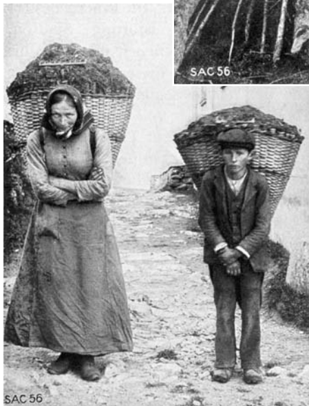
Abbildung 3: Frau und Knabe mit gefüllten Chris-Tschifferen (Eggwald, Zeneggen, STEBLER 1922, S. 98).