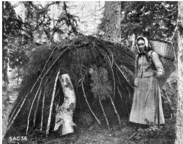
Abbildung 2: Tristenartiger Waldstreuhaufen mit Deckholzschicht in den Vispertaler Sonnenbergen (Wallis): Frau mit Chris-Tschifferen (Eggwald, Zeneggen, STEBLER 1922, S. 99).

ling, wobei sich der genaue Nutzungszeitpunkt in erster Linie danach richtete, ob der Waldboden genügend trocken war. Die im Herbst gesammelte Streue wurde meist direkt mit Tragtüchern oder grossen Rückentragkörben («Chris-Tschifferen», «Streuwi-Chorb», «Grissnadlehutte», «Laubhutte») – nicht selten von Frauen und Kindern – in den Stall, in dem das Vieh gerade untergebracht war, getragen und sofort verbraucht. Im Frühjahr trug man die Streue dagegen zur Zwischenlagerung vorerst in tristenartigen Haufen zusammen. Damit diese riesigen runden Streuehaufen mit bis zu vier Metern Höhe und Durchmesser in der Zwischenzeit nicht vom Wind verweht oder vom weidenden Kleinvieh zertreten wurden, versah man sie mit einer Deckholzschicht (Abbildungen 2 bis 4). Beim winterlichen Abtransport wurde die Streue dann samt der ange-