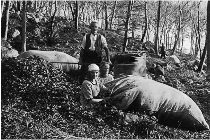
Abbildung 7: Laubertag in Betlis (St. Gallen): Die ganze Gemeinde sammelt trockenes Buchenlaub zum Stopfen der Bettunterlagen (BROCKMANN-JEROSCH 1928/30 I, Abb. 42).