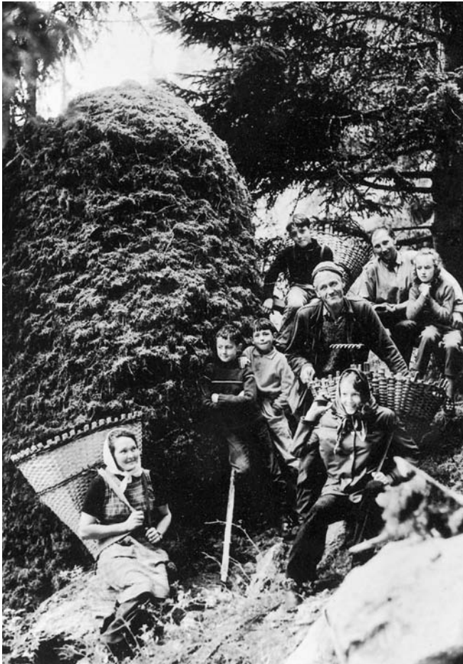
Abbildung 5: Nadelstreunutzung in den Vispertälern (Wallis): Tristenartiger Waldstreuhaufen, Chris-Tschifferen, Adlerrechen (um 1965, A. Imboden, Zollikofen – repr. in KEMPF 1985).

lich machten, schon vor 1800 stattgefunden zu haben; die Folgen prägten den grössten Teil des hier behandelten Zeitraums. 1818 sah KASTHOFER im Berner Oberland keinen einzigen zugänglichen Buchenwald, «der nicht von seinem obersten Anfange bis an sein unterstes Ende ganz rein von Buchenlaub gewischt worden wäre.» 49 Auch sei am Brienzersee zur Versorgung von Gemeinden ohne eigene Buchenwälder ein schwungvoller Handel mit jährlich etlichen hundert Schiffsladungen Buchenlaub aufgezo-gen worden. 50 Dies bedeutete für manchen Armen eine willkommene Einkommensquelle, denn ein Zentner Buchenlaub sei immerhin mit etwa zehn Kreuzern bezahlt worden. 51 Rund ein halbes Jahrhundert später hat sich an dieser Situation noch nichts geändert. Gemäss FANKHAUSER wurde im Berner Oberland 1874 das Laub der Buchenwälder so sorgfältig zusammengewischt, «dass man oft die zurückgebliebenen Blätter zählen könnte...», und jener «schwunghafte Handel mit Laubstreue, welcher die Waldungen am rechten Ufer des Brienzersees so sehr gefährdet», existierte nach wie vor. 52 Ähnliche Zustände aus dem 19. Jahrhundert sind überliefert für das Wallis, wo viele Nadelwälder sozusagen rein ausgefegt wurden 53 oder für Uri, wo man in den Laubwäldern den Boden oft so gründlich gefegt habe wie in einer Tenne. 54 1891 konstatierte BÜHLER im «Volkswirtschaftslexikon der Schweiz», dass vielerorts in den Berggebieten die Waldstreue sogar höher veranschlagt werde als die