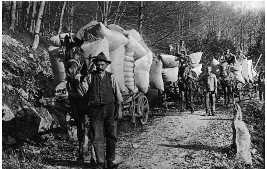
Abbildung 8: Die Buchenlaubernte wird am Abend mit Pferd und Wagen nach Hause geführt (BROCKMANN-JEROSCH 1928/30 I, Abb. 43).

Dass die Bedeutung des Bettlaubs weit über solche gut überlieferten Einzelbeispiele hinaus ging, deuten die folgenden Belege an: Vielerorts bekamen die Schulkinder einen institutionalisierten freien Tag zur Bettlaubgewinnung; 102 der Urner Oberförster propagierte 1890 Holzwolle als Surrogat für Bettlaub; 103 noch im frühen 20. Jahrhundert wurde im Appenzell ein ärmlicher Haushalt mit «Laub onder, Laub ober» bezeichnet; 104 in Zwischbergen (Wallis) existierte mit «Bissagga» eigens ein Wort für den mit Buchenlaub gefüllten und als Schlafunterlage dienenden Sack, 105 im Tessin und im Bergell (Graubünden) benutzte man als Bettunterlage nicht die Blätter der Buchen, sondern «wegen ihrer federkraft» diejenigen der Kastanien. 106 Umgekehrt hielt sich im Saanenland (Berne Oberland) ein minimaler Getreidebau nicht wegen der Körner, sondern wegen des Bettstrohs, 107 und in den Vispertälern (Wallis) herrschte noch 1922 nicht zuletzt deshalb ein Streuemangel, weil das Stroh traditionellerweise zur Füllung der Bettunterlagen verwendet wurde. 108