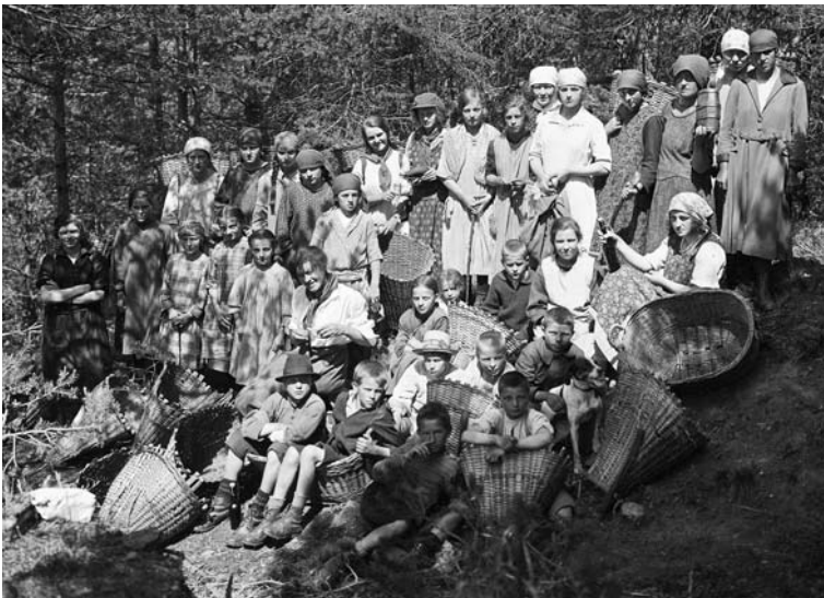
Abbildung 10: Am Vortag von Fronleichnam machen sich Burschen und Mädchen auf den Weg, um mit «Tschiffre» und Körben aus dem Thelwald bei Visp in grossen Mengen «Miesch» zu holen, mit dem dann der Altar geschmückt wird (1922, Christian Fux, Visp – repr. in Fux 1996).