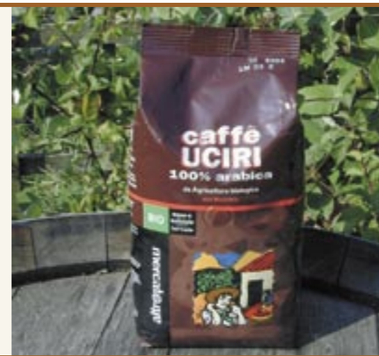
Kaffee UCIRI Caffè UCIRI

La suddivisione in Paesi produttori e Paesi consumatori di caffè è rimasta un'eredità del periodo coloniale: la lavorazione del caffè grezzo attualmente avviene principalmente nei Paesi consumatori. I Paesi del Sud continuano a svolgere il loro ruolo tradizionale, infatti, circa 2/3 del prezzo al consumo è destinato ai Paesi industriali. Ai coltivatori del cosiddetto "Terzo Mondo" spetta solo una minuscola parte del prezzo finale del caffè. Organizzazioni come "Faire Trade" o le "Botteghe del Mondo" mirano a creare un commercio del caffè equo e solidale.