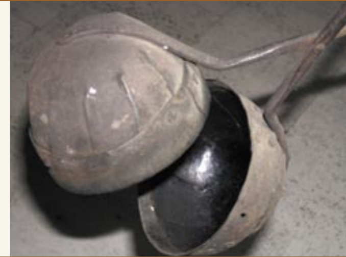
Kugelröster für den Hausgebrauch aus Vintl, Pustertal Tostacaffè di Vandoies a forma di palla per uso domestico

Albina Erschbamer di Vilpiano a proposito del caffè di malto raccon-