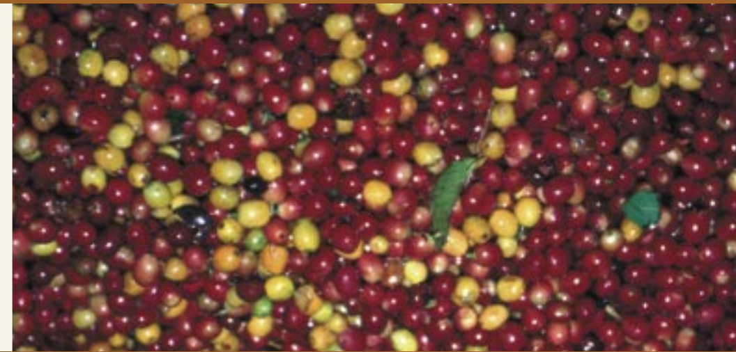
Kaffee ist ein weltweites Handelsgut. Transportiert werden die gereinigten, aber noch ungerösteten Kaffeebohnen in Jutesäcken. Il caffè è un bene commerciale diffuso in tutto il mondo. I chicchi di caffè puliti, non ancora tostati, vengono trasportati in sacchi di iuta.