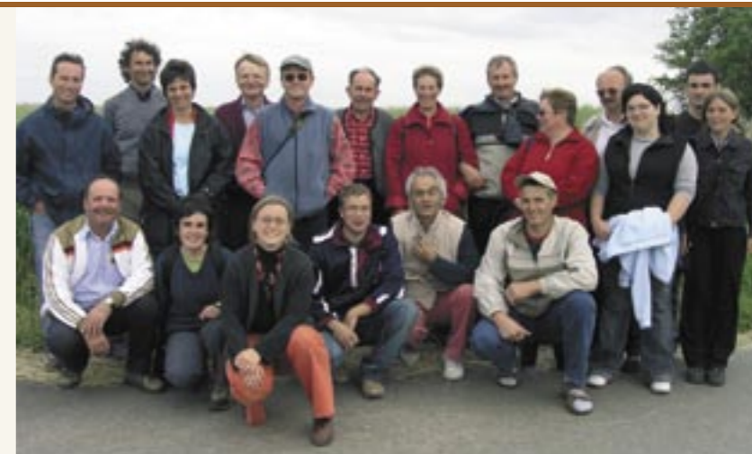
Altreierinnen und Altreier zu Besuch beim Wertheimer Lupinen-Kaffee (aus der Weissen Lupine hergestellt) Abitanti di Anterivo in visita presso i coltivatori di lupini bianchi a Wertheim

Wissen zum Altreier Kaffee und anderer Kaffee-Ersatz-Pflanzen in Südtirol zu dokumentieren und festzuhalten. Darüber hinaus wird durch Inhaltsstoffanalysen, Proberöstungen und Geschmacksverlusten erlassen, ob aus der Lupinenart ein interessanter Kaffee-Ersatz entwickelt werden kann.