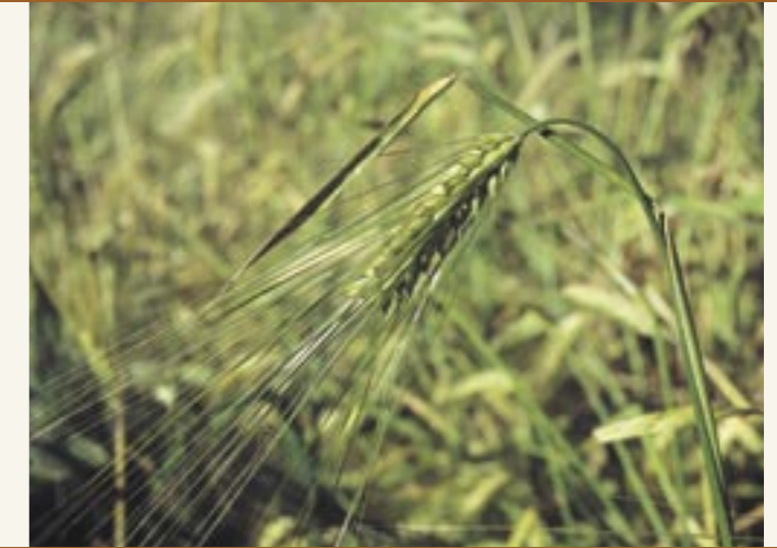
Gersten-Ähre Spiga d'orzo

Anche in Alto Adige l'orzo, la segale e fichi coltivati nel proprio orto erano le materie prime più importanti per la preparazione del caffè. Gli anziani interpellati in merito ai surrogati del caffè, inoltre, ricordano anche le seguenti piante: cipero dolce, soia e lupini. La cosa interessante è che tutte e tre necessitano di un clima caldo. In Val Venosta si narra anche dell'impiego della cosiddetta “pera Pala” quale surrogato del caffè.