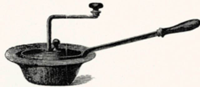
Abb. 7. Veralteter Kaffeeröster für Hausgebrauch.