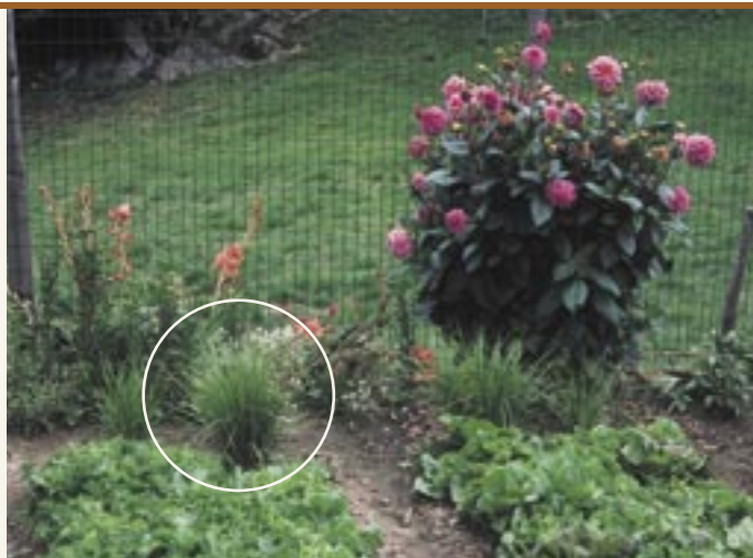
Erdmandel-Pflanzen (Im Kreis) Cypero dolce (nel cerchio)

In der Literatur finden sich zahlreiche Hinweise, dass in Tirol Lupinen als Kaffee-Ersatz genutzt wurden. Im sehr umfangreichen,