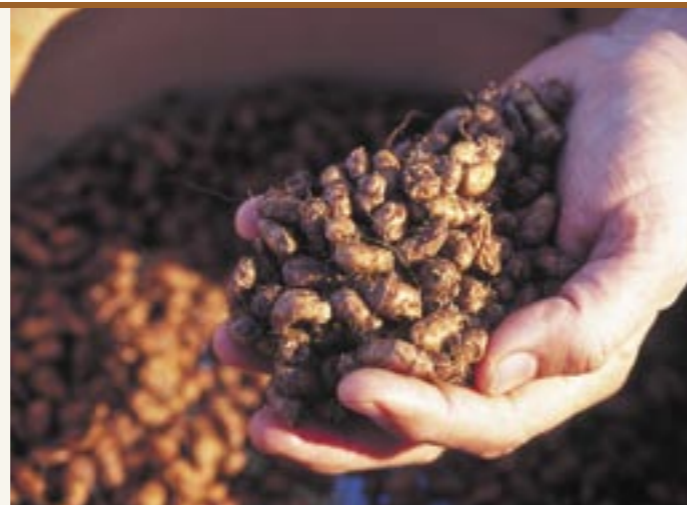
Erdmandeln frisch geerntet Dolcichini o babbaggi

del caffè è documentato sia dalla letteratura che dai racconti degli anziani.