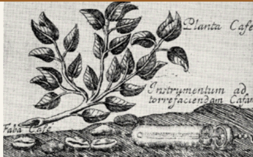
Dieser Kupferstich aus Paris stammt aus dem Jahre 1685 und zeigt die Kaffeepflanze, einen Röstapparat und einen türkischen Kaffeetrinker. Questa incisione su rame, proveniente da Parigi, risale all'anno 1685 e raffigura la pianta del caffè, un apparecchio per la tostatura ed un bevitore turco di caffè.

Blutdruck und Körperwärme erhöht, die Nierentätigkeit verbessert, aber die Hauttätigkeit vermindert. Übermäßiger Kaffeegenuss kann Überreizung, Schlaflosigkeit, Muskelzittern verursachen. Womit wir wieder bei den Alternativen des Bohnenkaffees wären, den Kaffee-Surrogaten, die aus diesem Grund auch immer wieder als "Gesundheitskaffee" bezeichnet wurden. Wer gleich mehr zu Kaffee-Surrogaten wissen möchte, kann die folgenden Seiten überspringen und auf Seite 16 weiterlesen.