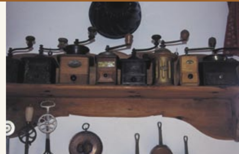
Kaffeemühlen Macinini per il caffè