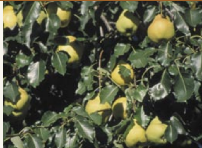
Birnen der Sorte ‚Palabirne‘ Pere della varietà „Pala“