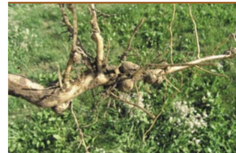
Knöllchenartige Verdickungen an den Wurzeln Protuberanze a forma di tubercolo sull'apparato radicale delle piante

che gli ha consentito di analizzare in breve tempo vaste popolazioni di piante, lo scienziato Reinhold von Sengbusch ha potuto determinare il contenuto di alcaloidi di un elevato numero di esemplari. Su un campione di 1,5 milioni di individui è riuscito a selezionare 3 piante di lupini gialli e 2 piante di lupini blu praticamente prive di queste sostanze amare, creando così il presupposto per la selezione dei cosiddetti “lupini dolci”. 16 Insieme a quelli di soia i semi del lupino dolce sono i semi a più elevato contenuto proteico e di sostanze grasse. Si definiscono “dolci” le specie il cui contenuto di alcaloidi si trova sotto la soglia dello 0,03%. 17 Le specie più antiche di questi lupini presentano livelli di alcaloidi più alti che dovevano essere rimossi, mettendo ripetutamente a bagno i semi prima del loro consumo.