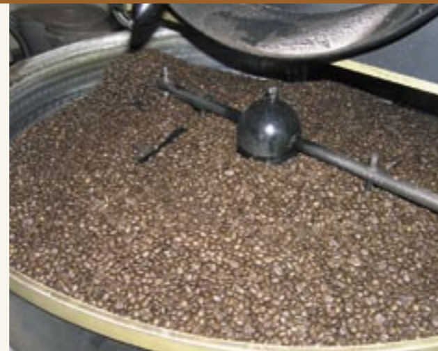
Frisch gerösteter Bohnenkaffee Chicchi di caffè appena tostati