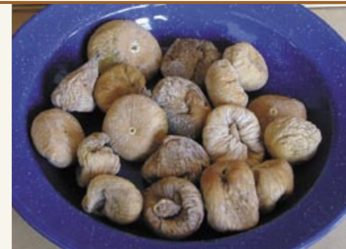
Getrocknete, handelsübliche Feigen Fichi secchi acquistabili nei negozi

Nella letteratura troviamo molti riferimenti all'impiego dei lupini in