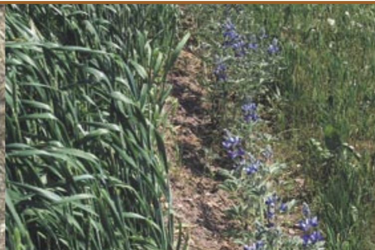
Meist wurde der "Altreier Kaffee" in einer Zeile am Getreideacker angebaut Di solito il "Caffè di Anterivo" veniva piantato in una fila nei campi di cereali

di Col di Sotto la sua famiglia possedeva alcuni campi, uno dei quali appunto, di caffè: "So che gli ultimi (giorni) di febbraio il nonno tirava fuori la "benna", così si chiamava il cestone per il letame e ci metteva sopra l'aratro, (...) quindi ci annunciava, "adesso andiamo a Col di Sotto, a preparare il campetto di caffè." Si spargeva il concime e si dissodava la terra. A volte capitava di trovare alcune zolle di terra ancora ghiacciate. Concluse le operazioni di aratura il padre diceva: "Adesso, quando volete, potete andare a seminare." Il periodo in cui normalmente avveniva la semina del caffè andava dall'inizio a metà di marzo.