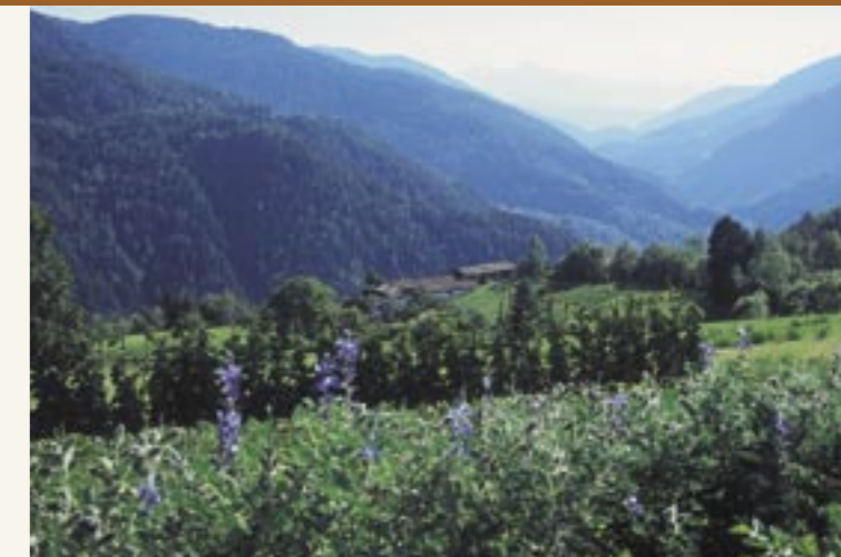
"Kaffeeacker" mit Blick ins Cembratal "Campo di caffè" con vista sulla Val di Cembra

Il caffè di Anterivo è parte della memoria collettiva degli abitanti dell'omonimo paese; molti di loro lo hanno coltivato e/o bevuto personalmente, altri ricordano di averlo visto coltivare dalle loro madri, nonne o zie. Per documentare quest'arte locale e consolidare il ricordo storico e culturale del Caffè di Anterivo, sono state realizzate, avvalendosi degli strumenti della ricerca sociale qualitativa, 11 interviste alla popolazione locale che poi sono state registrate su nastro. Poiché alcuni colloqui hanno visto coinvolti 2 o più interlocutori, in totale le persone che vi hanno preso parte sono state 15. I colloqui sono stati condotti sotto forma di interviste semi-strutturate,