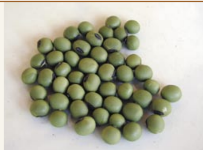
Grünsamige Soja-Sorte Varietà di soia dai semi verdi