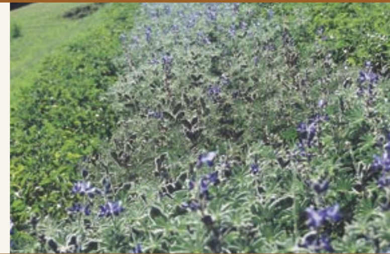
Pflanzen der Lupine "Altreier Kaffee" Pianta del tipo di lupino "Caffè di Anterivo"