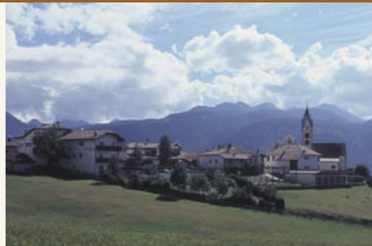
Die Ortschaft Altrei La località di Anterivo

Der Altreier Kaffee ist Teil des kollektiven Gedächtnisses der Menschen in Altrei, viele Menschen haben den Kaffee früher selber angebaut und/oder getrunken, andere erinnern sich, dass ihre Mütter, Großmütter oder Tanten den Kaffee angebaut haben. Um dieses Wissen und die Erinnerung an die lokale Kulturgeschichte des Altreier Kaffees zu dokumentieren, wurden mittels Methoden der Qualitativen Sozialforschung 11 Gespräche mit Menschen aus Altrei geführt, die auf Tonband dokumentiert wurden. Bei einigen Gesprächen waren 2 oder mehr Personen anwesend, so dass in Summe 15 Personen an diesen Gesprächen teilgenommen haben.