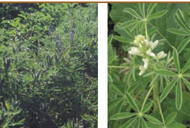
Die Blaue Lupine ( Lupinus angustifolius ) Il lupino blu ( Lupinus angustifolius )

Lupinen sind aufgrund ihrer attraktiven Blüten wohl den meisten Menschen bekannt. Man kennt sie als Zierpflanzen aus Gärten und als Ruderalpflanzen, die entlang von Waldsäumen und Rainen